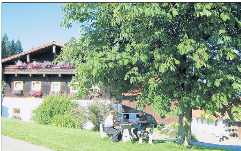
Friedenstadel mit Kastanienbaum und Sitzgruppe.

Eine kleine Stärkung aus dem Rucksack ist hier nicht verkehrt, denn weiter geht's ganz schön bergauf. Lässt man erst den Wald hinter